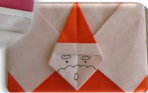
サンタ(顔)・ お手紙サンタ