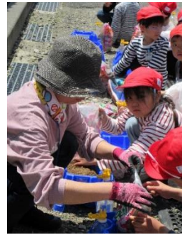
2学年が坂爪苗店まで出かけ、ナスやトマトを植えました。