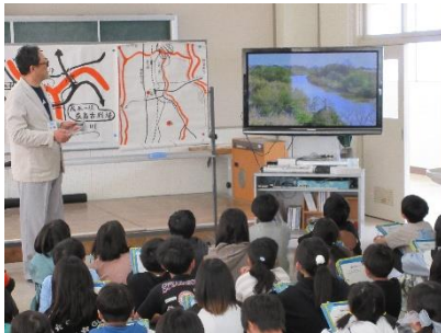
4学年は「能代川」を学び、