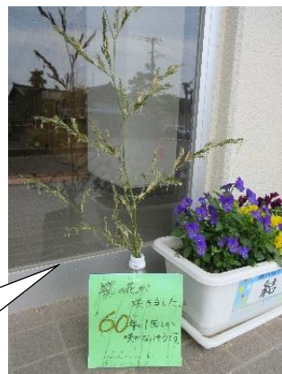
地域の方からは、なんとも 貴重な笹の花が届きました!