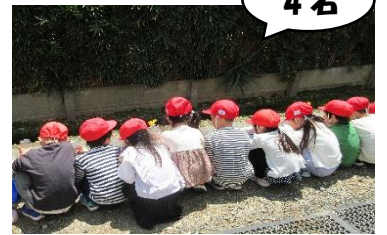
1学年は朝顔の植えです。 一緒に大きくなあれ!!