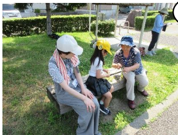
1学年「みそら野公園へ行こう」