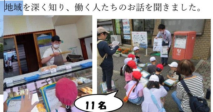
地域を深く知り、働く人たちの話を聞きました。