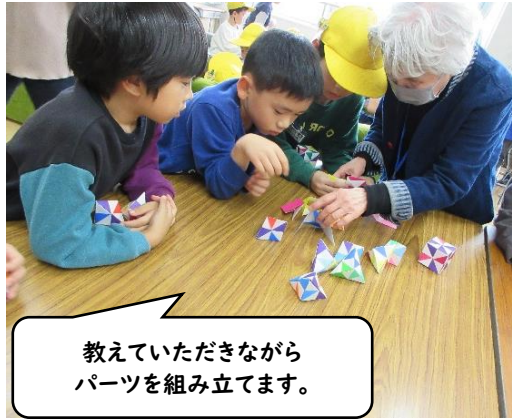
教えていただきながら パーツを組み立てます。