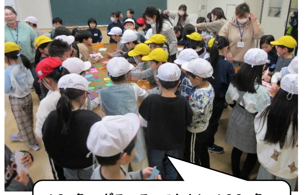
10名のボランティアさんと100名の みんなでクリスマスを楽しみました!