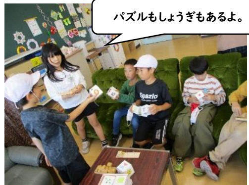
パズルもしょうぎもあるよ。